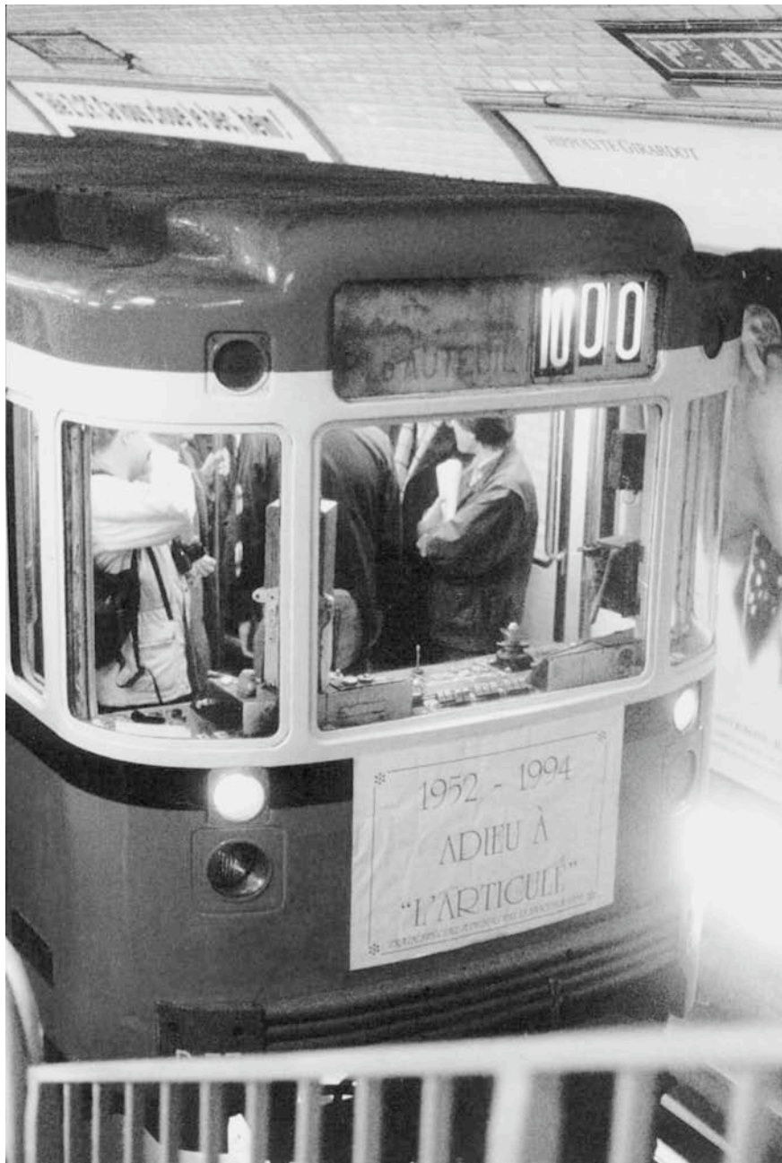
Train spécial ADEMAS du 15 janvier 1994. "Adieu à l'articulé - galette des Rois dans le Métro !"