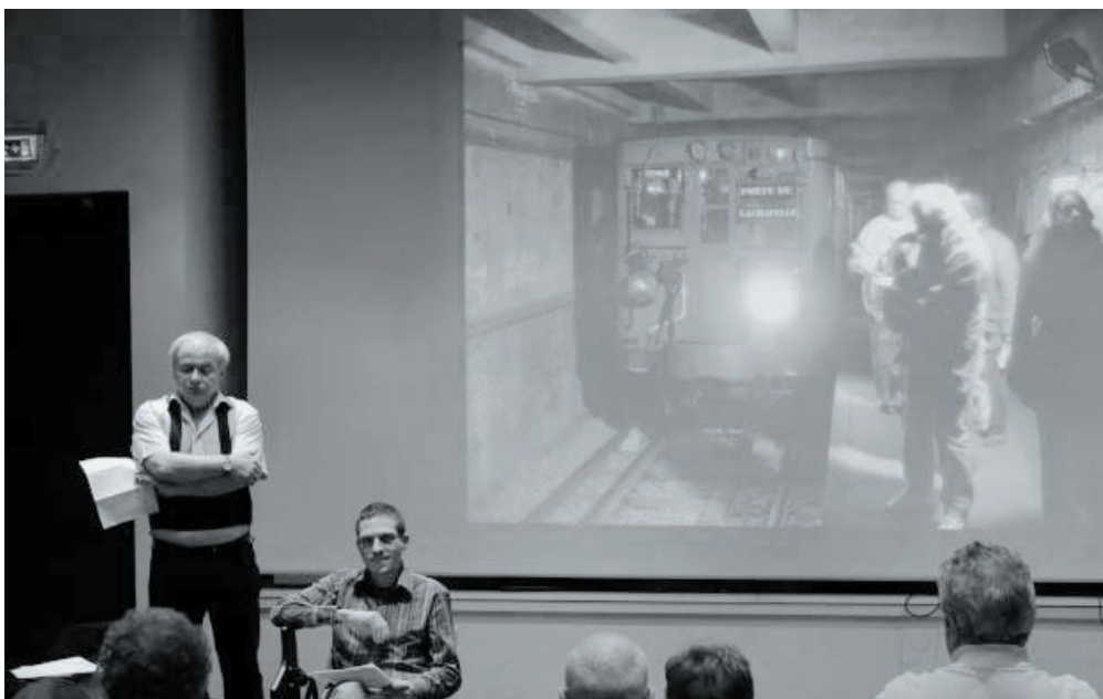
Le rapport d'activité par le Secrétaire.