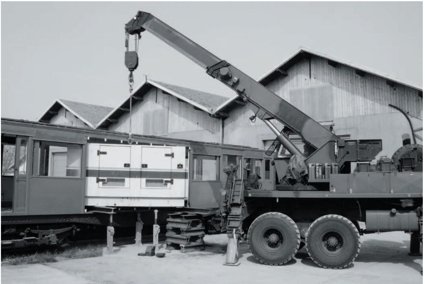
Le 10 avril 2008, le nouveau groupe électrogène est gruté dans la M. 340 en remplacement du groupe Berliet.