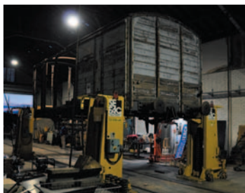
Activité sur le patrimoine militaire (N. Coudreau)