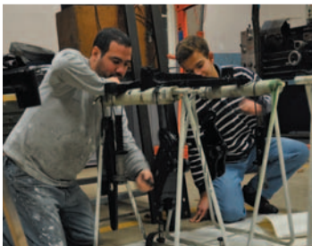
Atelier de peinture (N. Coudreau)

Les 29 (16h-21h), 30 avril (9h-19h) et 1er mai (9h-14h), « Ferrovi'art », espace Charenton, 327 rue de Charenton, Paris XII e , métro « Porte de Charenton », station intéressante au passage !