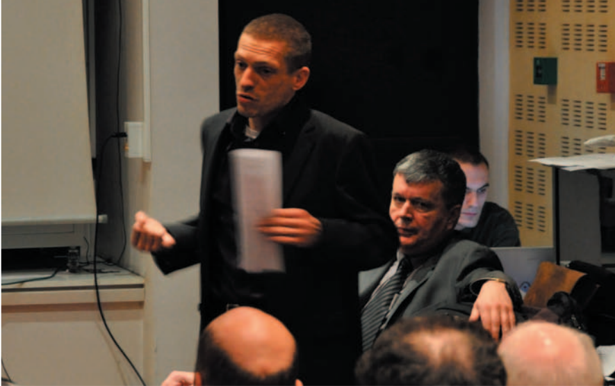
Une des interventions de l'Assemblée générale

Une nouvelle année chargée, avec des évolutions significatives