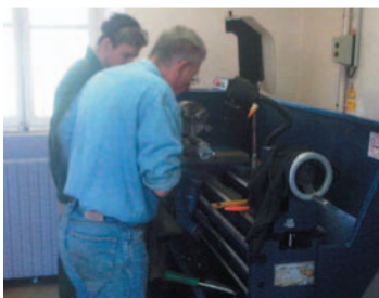
Remise en état du tour à métaux (J.-P. Devienne)