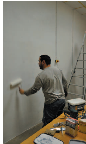
Peinture des nouveaux locaux (N. Coudreau)

Ce n'est pas demain matin que vous entendrez une Sprague siffler joyeusement en gare de Saint-Cyr GC, mais c'est aujourd'hui que nous devons nous y préparer !