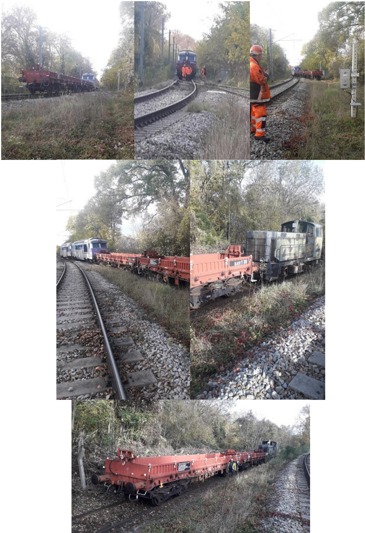
Une fois le convoi descendu sur l'ITE, après avoir refermé le taquet et basculé l'aiguille sur voie principale, départ des 2 machines CMR vers le faisceau SNCF des Matelots avant de rentrer à Villeneuve.